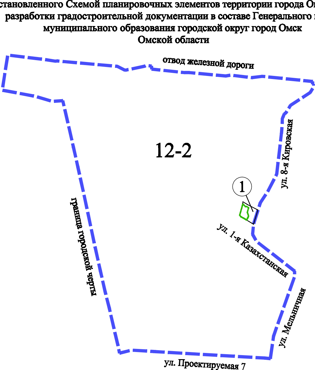
Схема расположения границ проектирования и планировочного элемента 12-2, установленного Схемой планировочных элементов территории города Омска для разработки градостроительной документации в составе Генерального плана муниципального образования городская округ город Омск Омской области

Приложение к проекту межевания территории, расположенной в границах: южные границы земельных участков с кадастровыми номерами 55:36:190102:2157, 55:36:190102:3320 – западная граница земельного участка с кадастровым номером 55:36:190102:2032 – северная граница земельного участка с кадастровым номером 55:36:000000:159882 – восточные границы земельных участков с кадастровыми номерами 55:36:190102:2148, 55:36:190102:2149 в Кировском административном округе города Омска